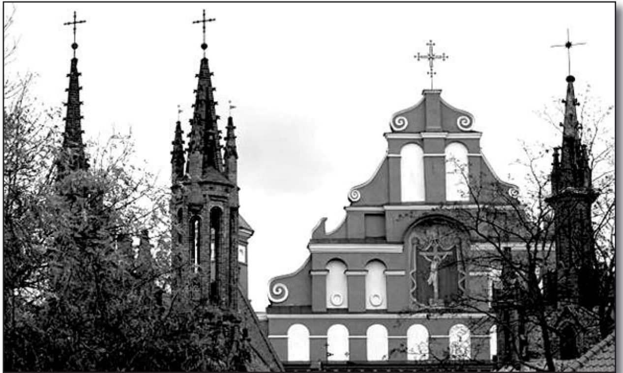
Vilniaus Bernardinų ir Šv. Onos bažnyčių bokštai.

Vasario 16-osios Aktas, apie kurį šiandien kalbame, grindžiamas iš esmės dviem žodžiais: nepriklausomybė ir demokratija. Šiuose žodžiuose, galima sakyti, telpa visa tautos ir valstybės problematika. Tauta, siekianti išgelbėti save, pirmiausia ir turi prikelti šiuos žodžius TIKRAM gyvenimui, nuvalyti juos, aprišti jų žaizdas ir netarti be reikalo, o jau sykį ištarus, grumtis už juos iki galo. Dabar kaip tik ir yra toks metas, nes būtent dabar vieningai, garsiai, su vidine jėga ir pasiryžimu pasakyti šie žodžiai gali ir turi tapti naujosios mūsų valstybės sparnais, po jais privalėtume tilpti visi – lietuviai, lenkai, rusai ir visi, gyvenantys šiame krašte ir savo darbu, kūryba bei gera valia purenantys tą lauką, kuriame dygsta laisvės pasėlis. Šiame lauke niekada nebus poilsio, jame užteks darbo visiems. Kiekvienam, nežiūrint jo tautybės ar politinių įsitikinimų, nes kur kitur žmogus galėtų realizuoti save, jeigu ne tautoje ir ne valstybėje? Čia mūsų namai, kur nors išeiti galima tik IŠ NAMŲ. Šiandien daugelį apakinęs „ėjimas į Europą“ ne vienu atveju yra pabėgimas nuo Lietuvos sunkumų ir nuo savo paties tuštumo. Ėjimą į Europą ar dar toliau suprantame kaip dvasinio augimo kryptį, kaip laisvą keitimąsi mokslo, kul-