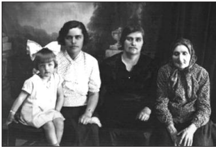
Mano sesuo, mama, močiutė ir prosenelė. Kupiškis, 1935

Išvakarėse labai ilgai kalbėjau su juo telefonu. Išklausiu visą programą – kaip gyventi, ko siekti, kuo rūpintis, kaip dirbti (nepradėt nuo neaprepiamų temų, nekaitaliot jį, bet vieną ištyrinėtą klausimą dėt prie kito, po truputį plečiant ir gilinant). Nenujaučiau nelaimės. Man atrodė, kad jis, toks gyvybingas, bus šalia visuomet. Kai gyvenau atskirai, mėgdavo kartais trumpam užvažiuoti į mano butą Žirmūnuose, kuri vadino studentišku, sėsdavo į supamąją kėdę ir prašydavo paleist plokštelę su kreolų mišiomis. Labai jas, tokias trankias, dramatiškas ir gyvas, mėgo. Prašė paleist jas ir per jo laidotuves. Bet į prašymą nebuvo atsizvelgta... Jeigu ko nors labai gailiuosi, tai to, kad Tėvas nesulaukė laisvos Lietuvos. □