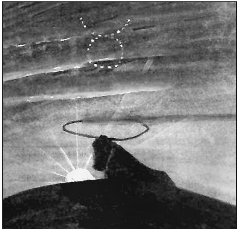
M. K. Čiurlionis. Zodiako ženklai. Jautis