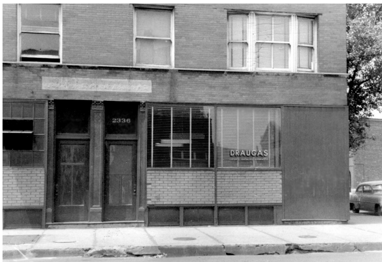
▲ „Draugo“ pastatas 1956 m. vasarą, prieš išsikeliant į naujas patalpas 63-iojoje gatvėje.

Išklausęs tokių „pamokymų“ supratau, kad net ir tarp tų žmonių, kurie