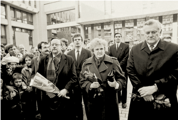
Vytautas Landsbergis, Danutė Prunskienė, Algirdas M. Brazauskas.

už tikrą“. Kaip pavyzdys pateikiamas faktas – Lietuvos klausimo realioje tarptautinėje plotmėje iškėlimas. Ir čia pat Dirva savo skaitytojams siūlė, vertinant įvykius Lietuvoje, užuot viską „priėmus už tikrą“, geriau juos nuolat remti, kad „nedingtų ir vėl nepasiekiamai“ 10 . Tuo buvo norima pasakyti, kad iševiją Lietuvoje kilusių esmingų idėjų bei pasiekimų nepriimtų kaip