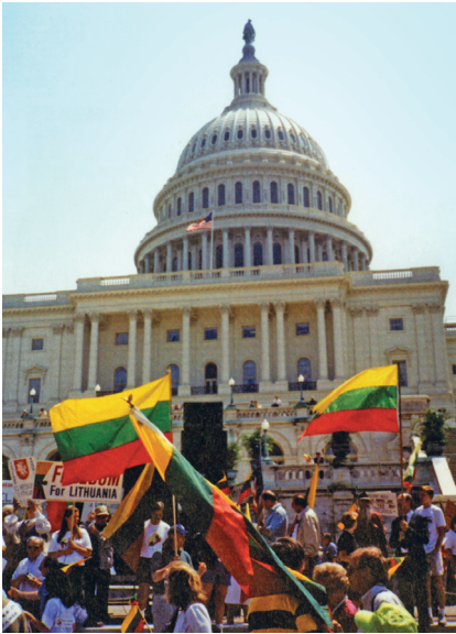
JAV lietuvių manifestacija prie Kongreso rūmų Washington'e 1990 m., siekiant Lietuvai laisvės ir nepriklausomybės pripažinimo. Lietuvių kultūrinis paveldas Amerikoje / Lithuanian Cultural Legacy in America. Print in USA, 2009, p. 48