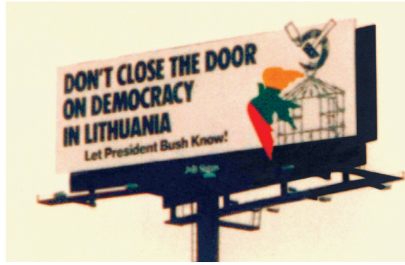
S. O. S. grupės parengtas stendas pakelėse.