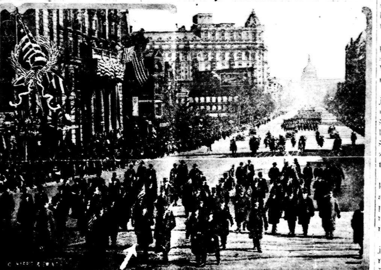
Prezidentas Wilsonas dalyvauja sugryžusių iš karės kareivių parodavime Washingtone.

Moterys skalbejos, kurios pas pasilaikancias šeimynas per dieną dienas skalbia balti- nius, ligšiol pasitenkindavo $2.50 už dienos darbą ir val- džioje reikalauja jau $3. valgio ir apmokėjimo gatveka- rių.