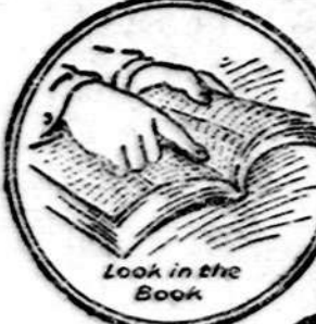
Look in the Book