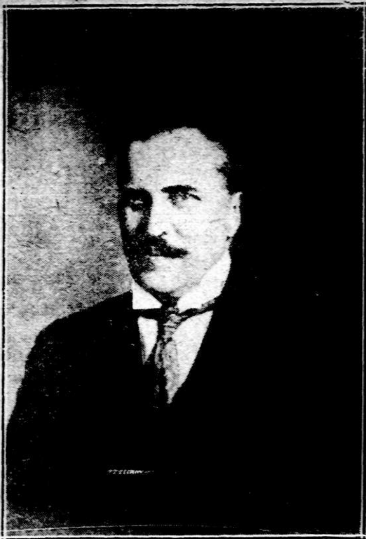
JONAS VILFISIŠ buv. Finansų Ministras.