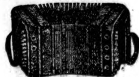
PEARL QUEEN KONCERTINA