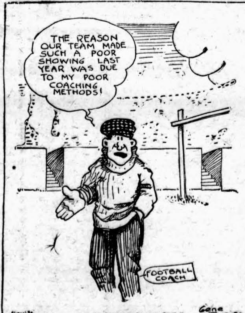
INTERNATIONAL CARTOON CO. N. Y. GENE BYRNES