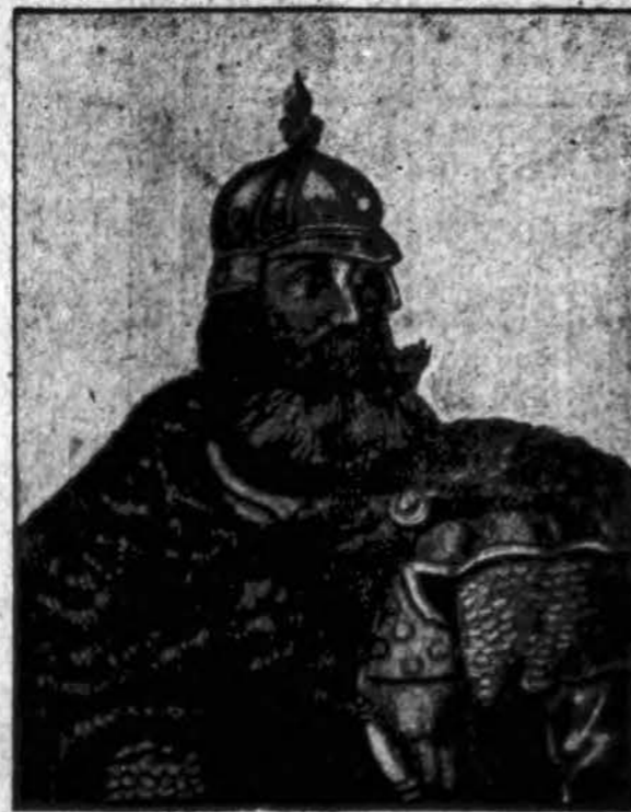
Kęstutis, D. Lietuvos Kunigaikštis