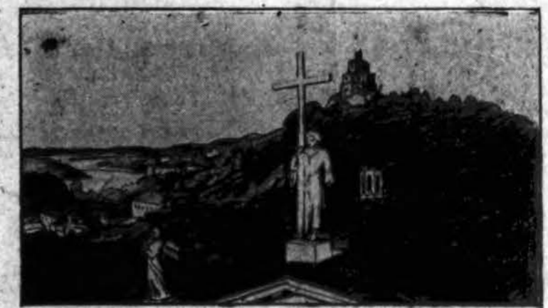
Vilnius — Lietuvos Sostinė. Lietuvi, nepamiršk savo tėvų miestol