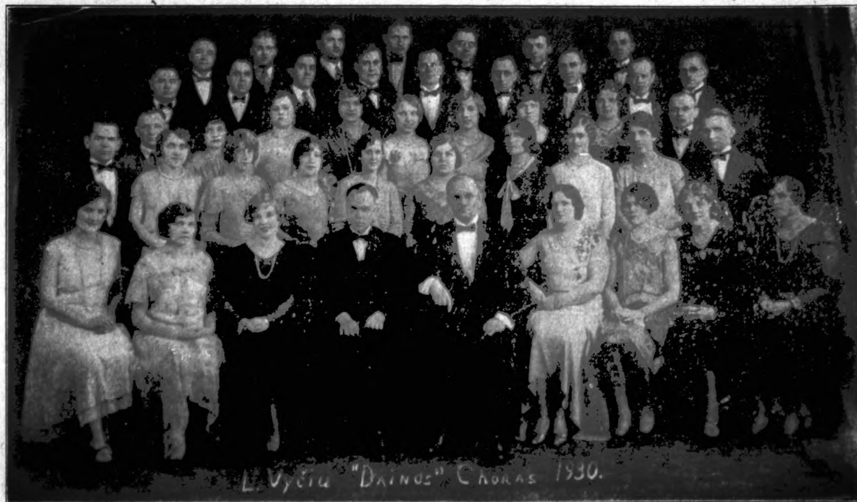
Choristai Dalyvaus Gražiuose Lietuvių Tautiniuose Kostiumuose. Šis Choras Dabar Yra Daug Skaitlingesnis.