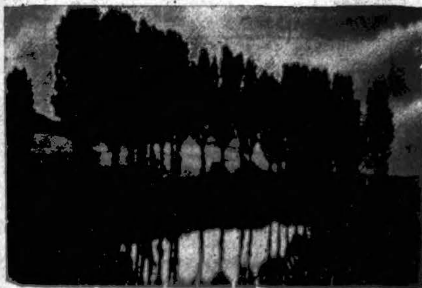
Kur bėga Šešupė, kur Nemunas teka Ten mūsų Tėvynė, brangi Lietuva.