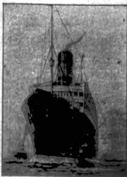
Laivas "United States"

Iš New Yorko į Klaipėdą ekskursantus lydės specialis "Draugo" palydovas.