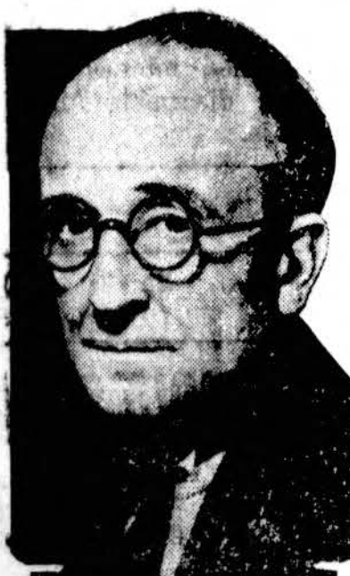
Salvador de Maderiaga, Ispanijos rašytojas, mokslininkas ir buvęs Tautų Lygos atstovas naujos Ispanijos vyriausybės paskirtas ambasadorium į Jungtines Amerikos Valstybes.

Kalbėdamas V. V. S. vardu, pareiškty, žinoma, ne tik savo nusistatymą, bet visos organizacijos ir kitų su kuriomis ji yra artimuose santykiuose. Mano čia pranešamos mintys yra išreiškiamos daugelio rašytojų, politikų ir visuomenės veikėjų V. V. S. laikraštyje "Mūsų Vilnius", kuris palaiko santykius su Vilniaus krašto lietuvių, vaizduoja daugeliu vaizdų ir žinių jų gyvenimą ir kovą ir, eidamas iš Kauno (Daukanto g. 3) kas dešimt dienų atseina Amerikos lietuviams 2 dolieriai. Atsiveikindamas su radio klausytojais, dar kartą raginu jus Vilniaus dalykus