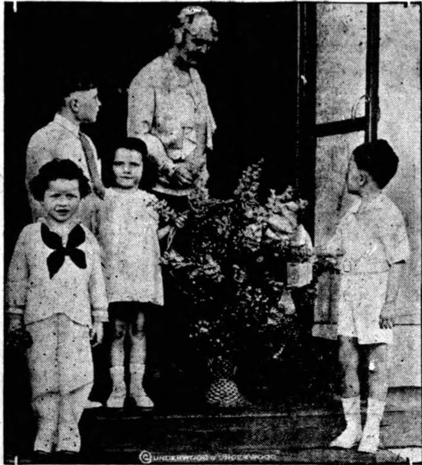
Keturi jauni Vaikų Sveikumo Kovotojai Vaikų Sveikumo dienoje prezidento žmonai Mrs. H. Hoover įteikė gyvųjų gegužės gelių puokštę.