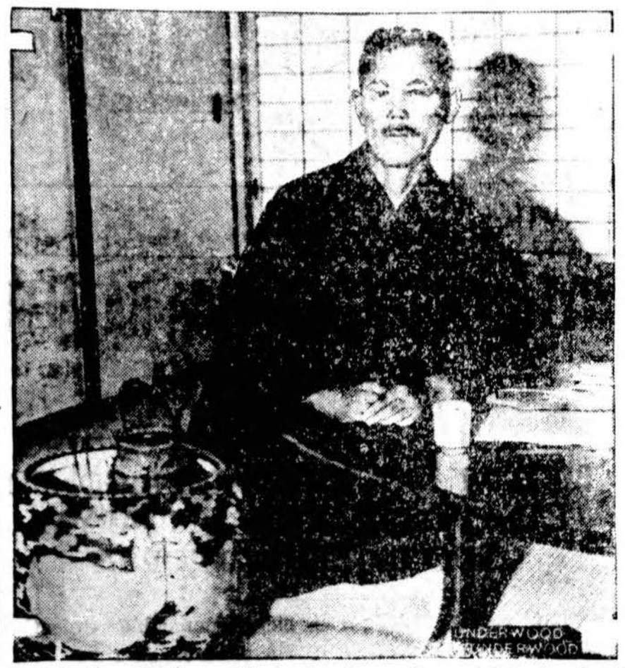
Reijiro Wakatsuki, naujas Japonijos ministrų pirmininkas, nufotografuotas savo namuose.

"Orlaivis apdaužytas ir tuščias. Kubilėliuose nebuvo žibalo. Pradėjova galvoti, koki būdu surasti prapuolusiu. Nežinojova, kurion pusėn eiti. Betyrinėjant apylinkę pa-