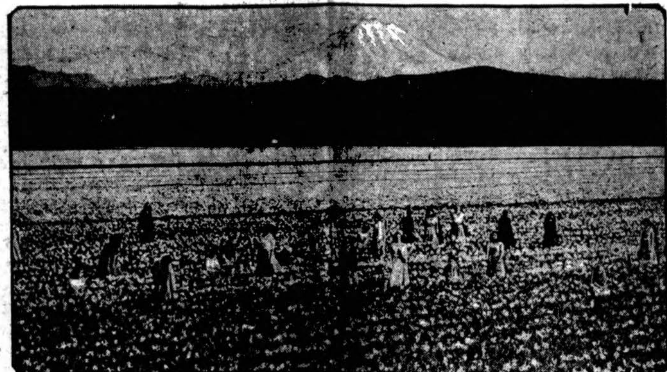
Atvaizduojama pražyduusių nareizų plotai, kurie apima tūkstančius akrų, arti Seattle, Wash. Aukščiau matomas sniegu apklotas Rainier kalnas.

HAVANA, Kuba, geg. 16. — Oriente provincijoje kilę maištai. Vyriausybė parūntė kariuomenę.