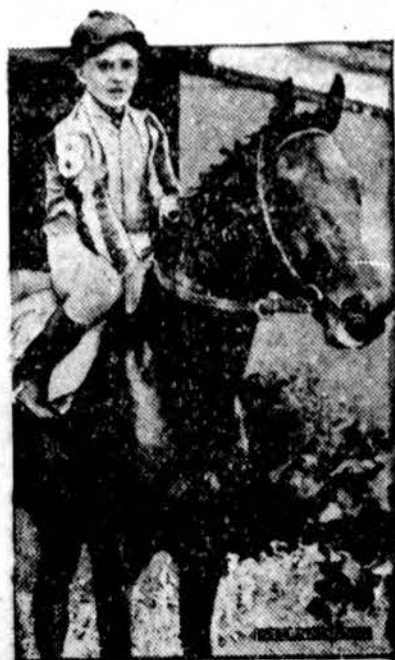
Arklis, laimėjęs Kentucky arklių lenktynes ir padaręs naują greitumo rekordą.