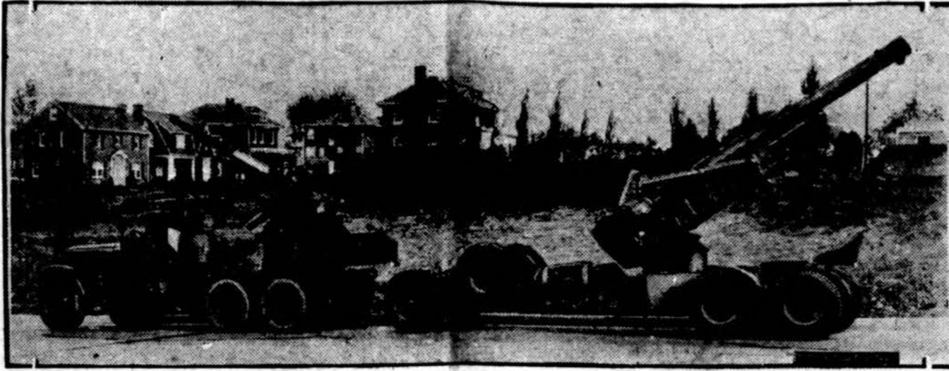
Amerikos J. Valstybių kariuomenėje įvesta taip vadinamos skrajojanti batarejos. Šiame vaizde viena tų batarejų atvaizduojama. Gali važiuoti 50 mylių valandoje.