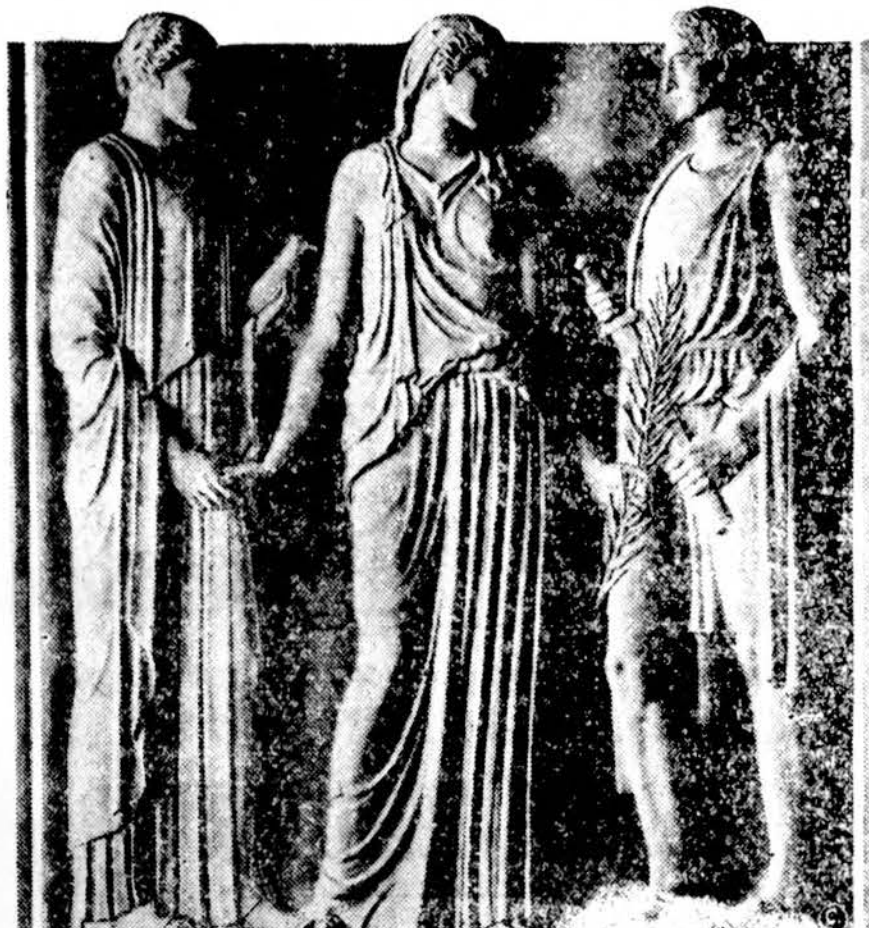
Pertaisius (remodeliavus) Nežinomojo Kareivio kapą Arlingtono kapinėse, ant kapo bus pastatyta ši skulptūra, kuri dabar išstatyta J. A. V. Karo Departamente, Washingtono. Tas trys alegorinės stovylos reiškia: vidury stovi Pergalė, kuri duoda pergales palnų Drąsai (vyriškos lyties), o kairėje stovi Taika su balandėliu, laikydama Pergalės ranką.