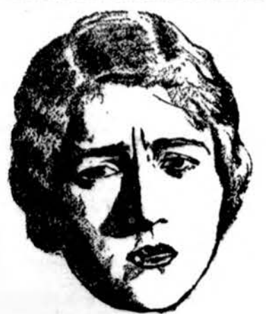
Jos Niekas Nekviečia

Nepaisant tokio rūpestingu-mo, o vis delto klaidų neišven-gta ir gana. Yra kai kuriose vietose ne visiškai išlygintas stilius, mintis ne visai aiški perskaičius, sunku atsiminti. Bereikalingai palikta neištai-syta klaida prieraše 10 pusl., kur paaškinta, jog 2 lietuviš-ki centai sudarą vieną rusišką kapeiką. Gal kuris jaunuolių