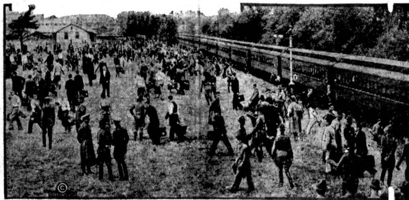
Tai Plattsburg, N. Y., stovykla, kur kas metai šimtai ir tūkstančiai jaunų vyrų lavinama. Atvaizduojamas traukinis, atvežęs į stovyklą tuos savanorius patriotus.