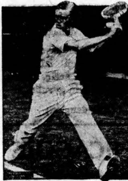
Sidney B. Wood, Jr., of the United States, who won the men's singles championship in the national tennis tournament at Wimbledon, England.

team at Waukegan, July 4th 1931. The Brighton Park K. of L. Girls team is one of the strongest among the K. of