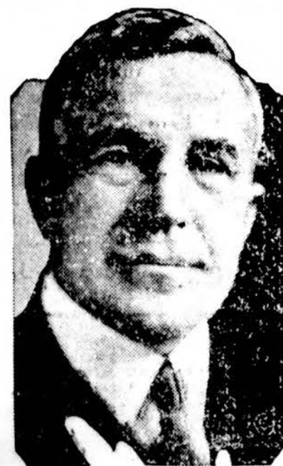
George Horace Lorimer, redaktorius savaitraščio "Saturday Evening Post" numatomas J. A. V. ambasadorium Anglijai vieton Dawies'o, kuris atšaukiamas reikale kampanijos už nepu'lttonų partiją busimose prezidento rinkimuos.

Šiandie gal jis nepavojingas, bet už kiek laiko jau gali būt pervėltu ką nors tam tumorui daryti. Ugnimi žaisti pavojinga.