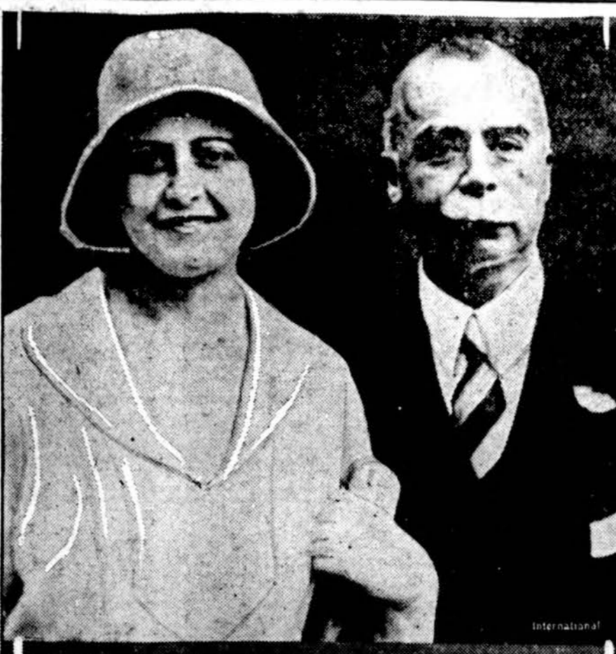
Clarence Mackay, telegrafų magnatas, ir Anna Case, žymi operų dainininkė po suotuoktūvių.