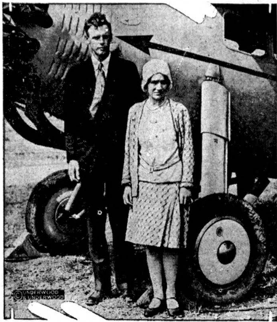
Garsus Amerikos lakuras Col. Charles A. Lindbergh su žmona, kuriuodu dabar pro Kanada ir Aliaską skrenda į Japoniją ir, gal būt, į Kiniją.