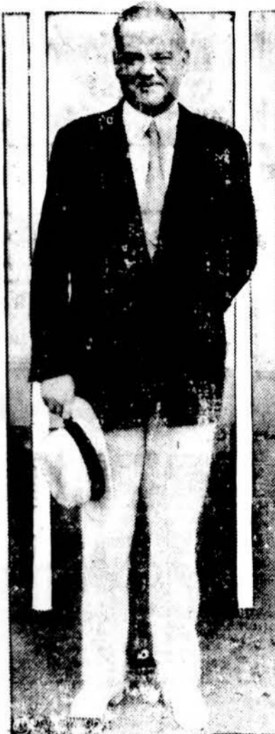
Jungtinių Amerikos Valstybių prezidentas Herbert Hoover, šimet švenčias 57 metų amžiaus sukaktuves.