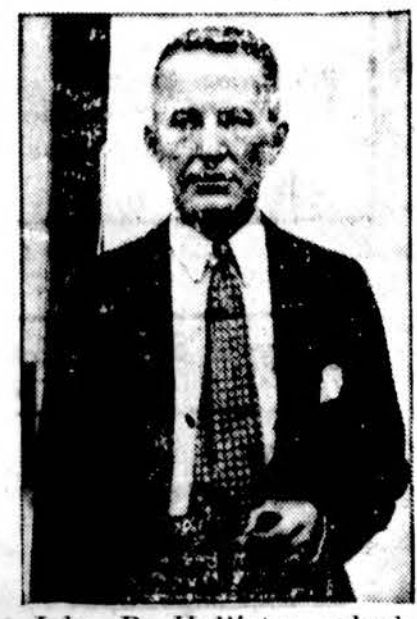
John B. Hollister, advokatas iš Cincinnati, Ohio, paskirtas senatorium į J. A. V. senatą vietoj mirusio senatorio Nicholas Longworth.

Skaitėme Lietuvos oficioze mintis esą Švietimo Ministerija nutarusi, ar bent nusistatęsi pervaryti pradžios mokytojus per žemės ūkio, darbo, dainavimo ir kitokius kursus. Prieš šitokį Švietimo Ministerijos nusistatymą espėj nie-