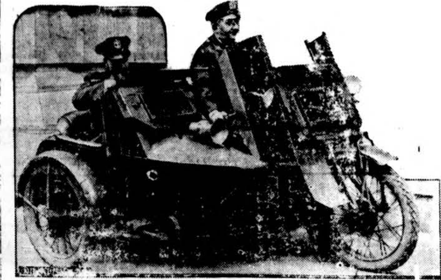
New Yorko policija neseniai tapo aprūpinta moderniais motoriniais triračiais apginkluotais kulkosvaidžiais karui vesti gengsteriais. Vienas tokių triračių, gatavas gengsteriams ugnį atidaryti, parodoma šiame atvaizde.

kiną, kuri pilnai supranta šių dienų gyvenimą ir kuri sugebės į iškylančius aktualius klausimus tinkamai ir gyvai atsilipti. Tat, sveikiname Jubiliejinio Federacijos Kongreso atstovus, palinkėdami jiems kuogeriausio pasisekimo svarbiame ir atsakomingu jų darbe!