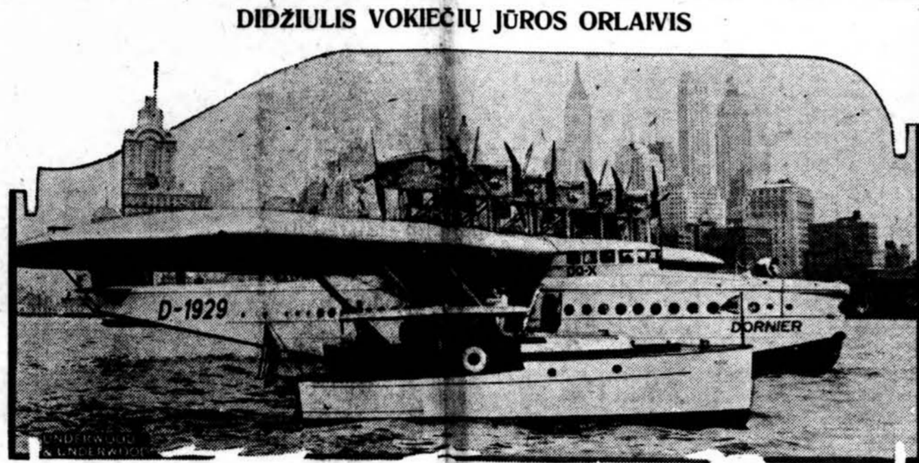
DIDŽIULIS VOKIEČIŲ JŪROS ORLAIVIS

Rašytojas Herwig buvo liūdininkas, kaip Vokietijoj vieno smarkumu kilo stipri socializmo banga ir kaip tada krikščionybė, ypač Katalikų Bažnyčiai, iškilo visa eilė neatidėliotųjų klausimų, kuriuos prisiėjo greitai laiku spręsti. Jau tais laikais velionis Herwig sėkmingai storbė katalikų tikėjimo prieš pažangia-