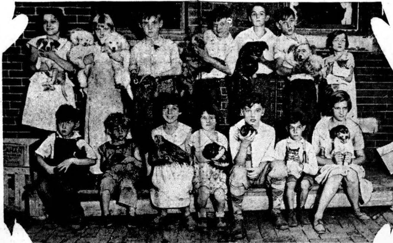
Kaip čia atvaizduojama, paroda suruošta Philadelphia Rytinė daly. Šią parodą pamatyti mokama vienas centas.

NETURTĖLIŲ VAIKAI SURENGĖ NUOSAVĄ PARODĄ