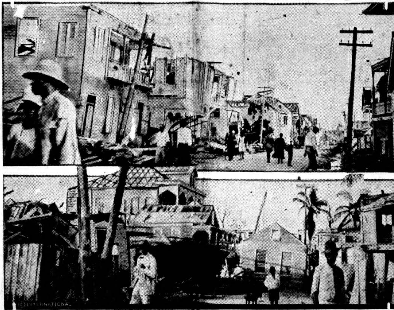
Taip atrodo kai kurios Belize miesto dalys po viesulo. Šis miestas yra Britų Hondurase, vidurinėje Amerikoje.

LONDONAS, rugs. 23. — Žinomas komikas Chaplin'as vakar susiejo ir kalbėjosi su indų tautininkų vadu Gandhi'u.