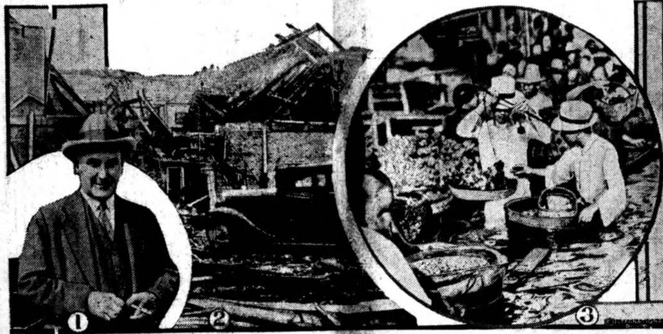
1. Dr. Jose Manuel'is Puig Casaurand'as naujas Meksikos ambasadorius J. Valstybėse. 2. Viešulo sugriauta mokykla Boston, Ind.; apie 40 mokinių sužeista. 3. Vaizdelis iš Hankow'o miesto, Kinijoje; potvynio metu pirkliai veda savo "biznį" braidžiodami giliam vandeny.

Federaliniam teisme Chicago įsisiūbuoja Capone'o byla.