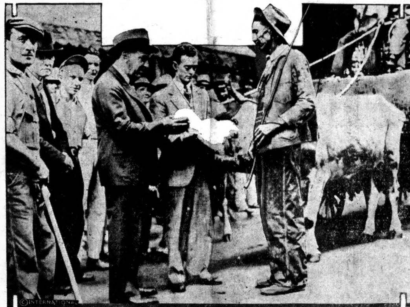
Georgia valstybės vienas ūkininkas nuvežė į miestą Atlanta pilną vežimą medvilnės. Viena parduotuvė jo medvilnę priėmė ir davė jam už tai reikalingų prekių. Taigi, šiam ūkininkui nerūpi nei valiutos stovis, nei aukso pagrindas.

Darbininkų atlyginimo mažinimą paskelbė Armour'o, Cudahy, Pullman'o ir kitos kompanijos. Girdi, tas daroma dėl gyvenimo atpigimo.