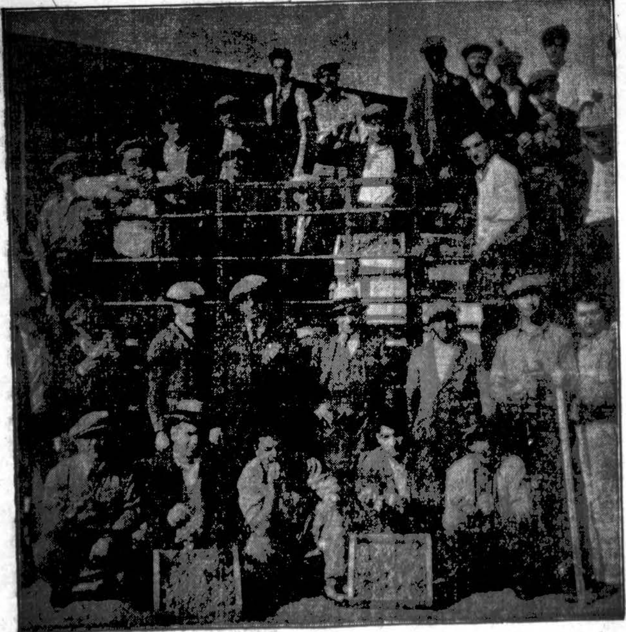
Įvairiose pramonėse ir išdirbystėse yra didelis perviršis. Išdirbiniamis nėra rinkos. Ūkių produktams rinka ir gi persiaura. Šiomet tik Kalifornijos vynuogių nėra per daug. Kas pasivėlys nusipirkti, tas gali visai negauti. Čia matome Chicago's Produce market, kur "jobberiai" suvažiavo parktis Kanrijos vynuogių.