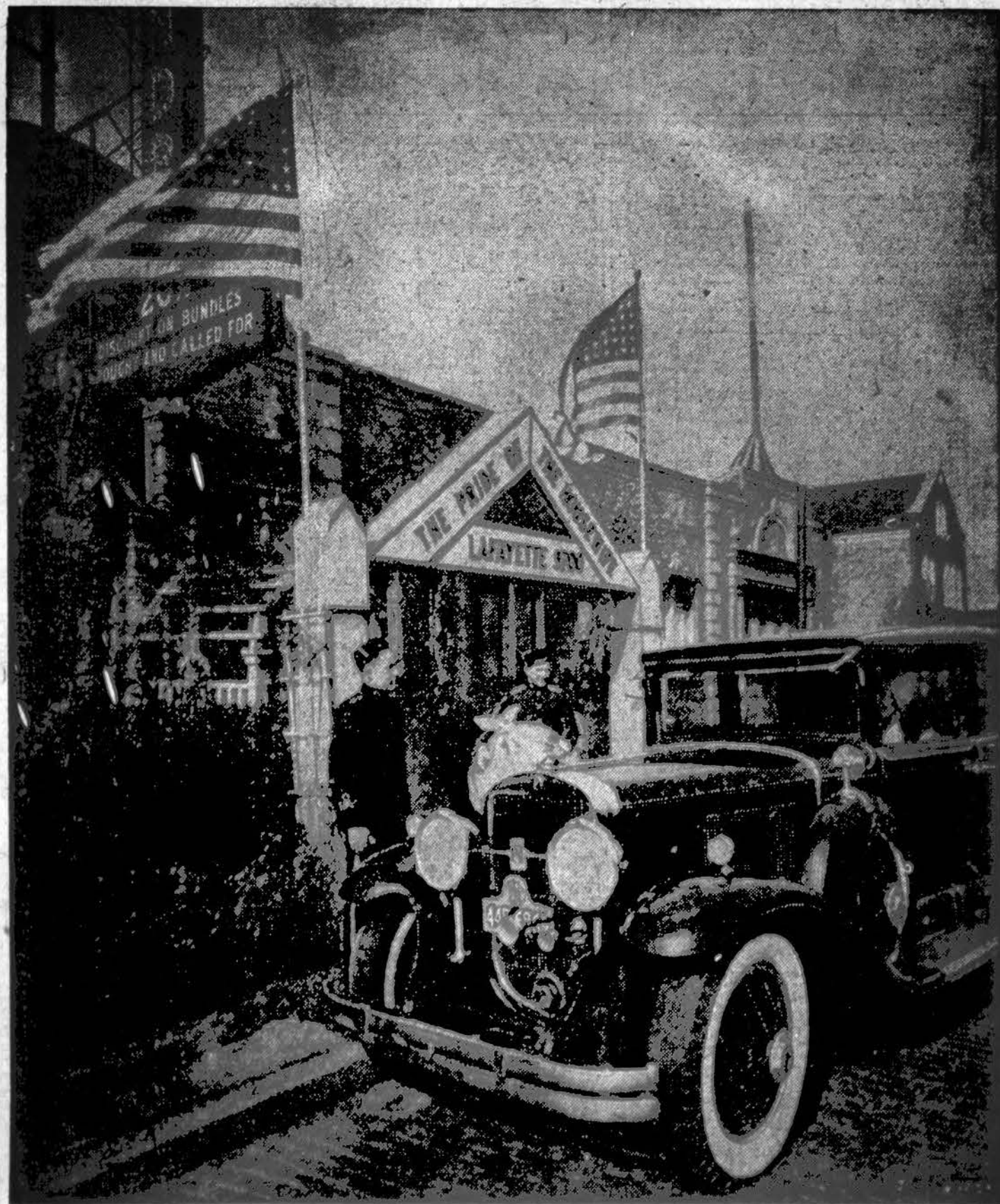
Ši fotografija parodo vieną iš mūsų tukstančių kostumerių pasinaudojančių šiuo pinigais taupinančiu "cash and carry" patarnavimu.