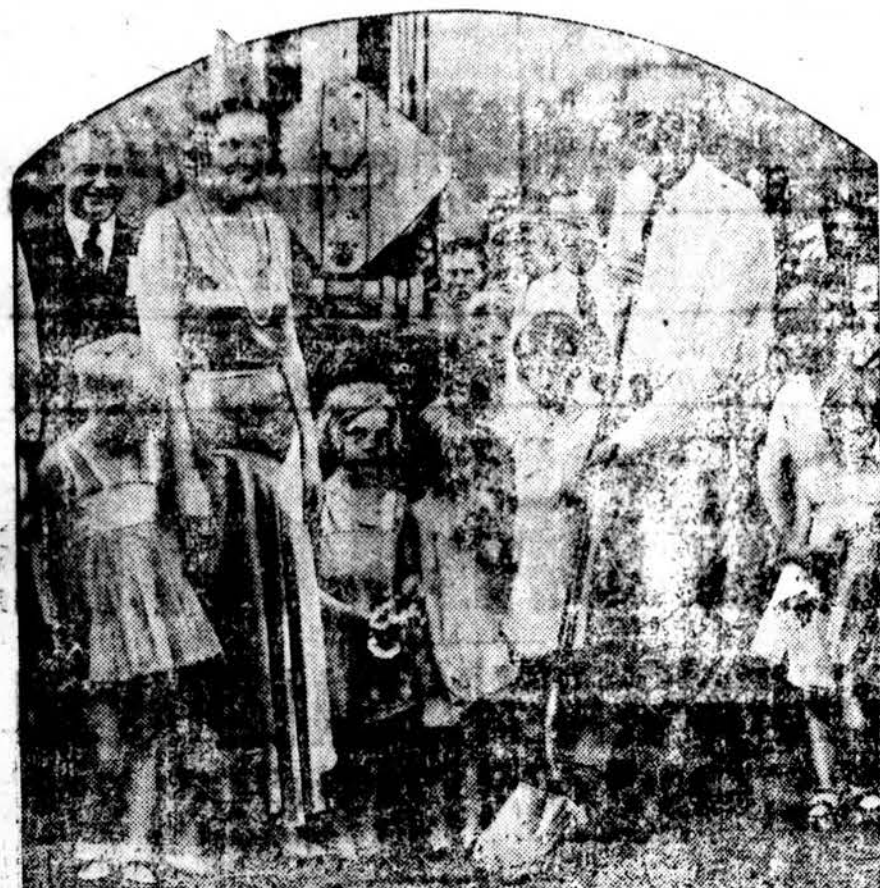
Pennsylvania valstybės gubernatorius Pinchot išmėta pirminę lopetą žemių vietoje, kur statoma milžiniška Pymatuning užtvanka (dam) 25 mylios aukščiau Sharon, Pa.