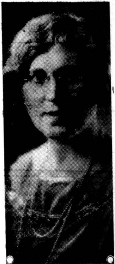
Pirminkė Moterų Šv. Kryžiaus Ligoninės Remėjų Dr.

jos. Šiandie spalio 21 d. šioji dr-ja rengia didelę pramogą Trianon Ballroome, 62 St. Cottage Grove ave. Pelnas tos pramogos eis šv. Kryžiaus ligoninės naudai.