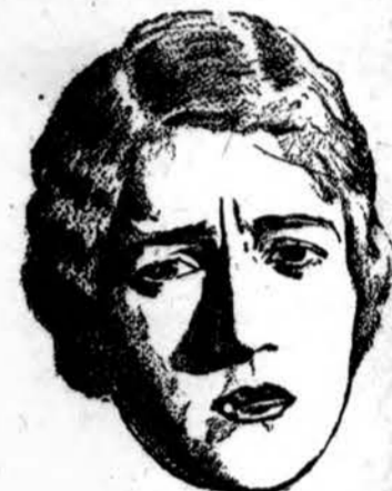
Jos Nieks Nekviečia

Ar žinot, kodėl jos nieks nenori? Ji pati to, nežino. Jos kvapas nemalonus. O to visd nekenčia. Išgargluodami su Listerine, išvalysime burną ir užmušime ligų perus. Vartok kasdien.