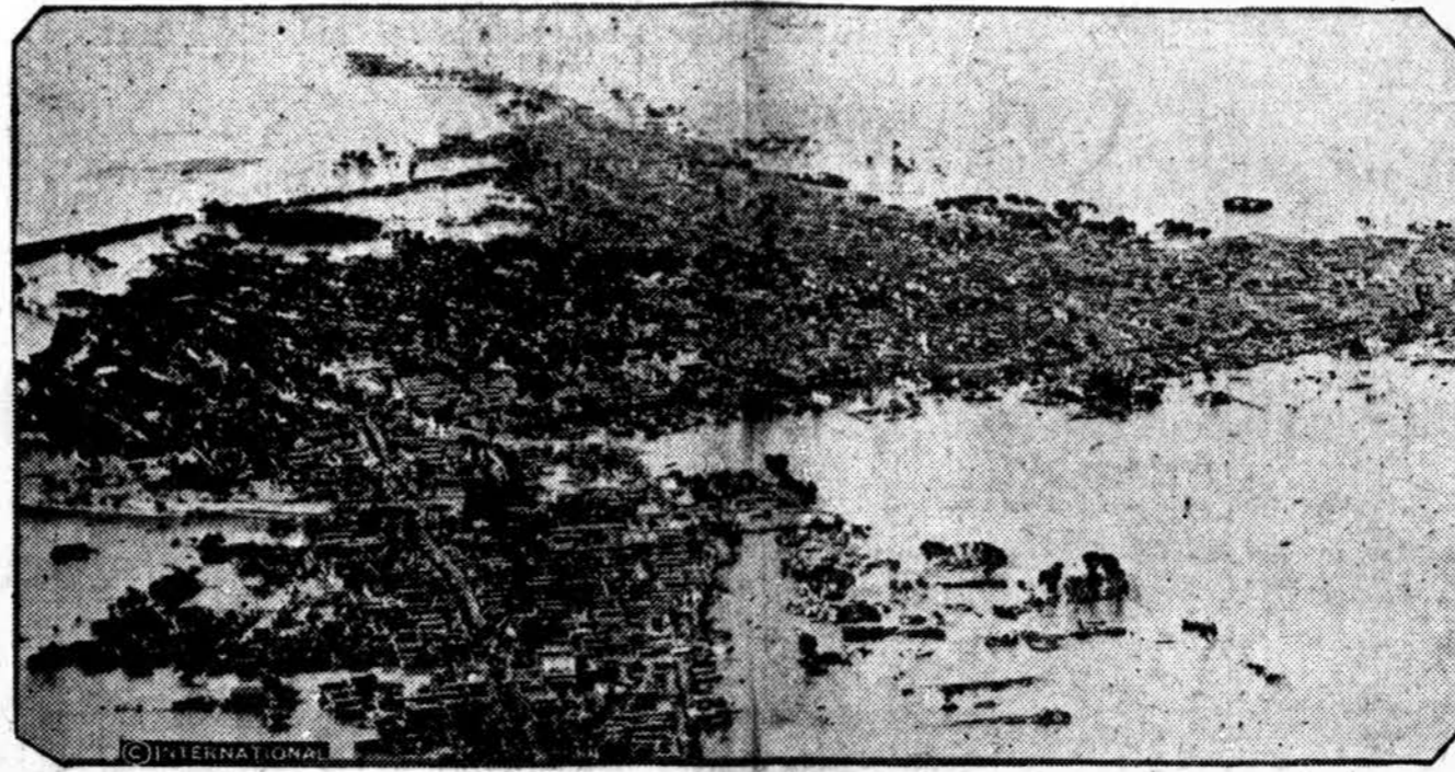
Dideli potvyniai Kinijoje padarė milžiniškų nuostolių, daug žmonių žuvo Yangtze's upeje patvinus. Čia atvaizduojamas užlietas Hingwa miestas.

Misijonierių centrai yra Mukdene ir Kirine. Šiuose miestuose gyvena apaštališki vikarai — vyskupai. Kirino