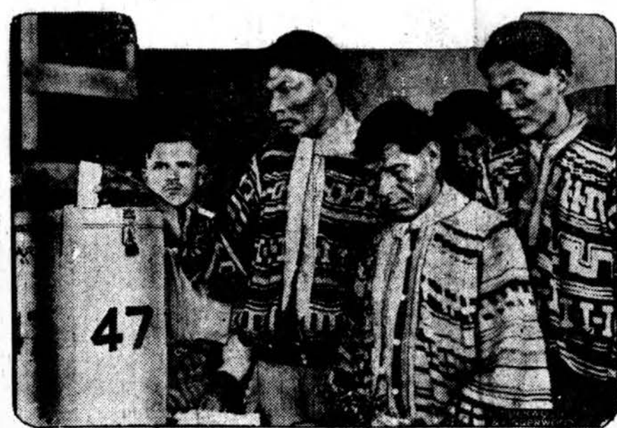
Seminolės indėnai, Miami, Fla., naudojami jiems pripažintomis pilietybės teisėmis — balsuoja.

Biure rasta moderniškos pasams spaudinti mašinos ir kiti įtaisymai.