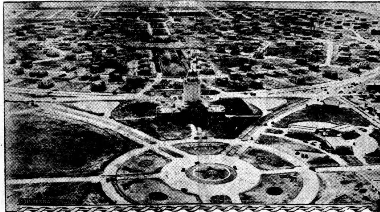
J. Valstybių lakūnų mokyklos reginys iš oro. Ši mokykla yra 16 mylių atstume nuo San Antonio, Tex.

DETROIT, Mich., lapkr. 10. — Pramoninkas Ford'as pareiškia, kad turintieji pinigų žmonės šiandien turi puikią progą paleisti savo pinigus į darbą. Laikomi be darbo pinigai yra lygūs nevaldomam bet kuriam kuno sąnariui.