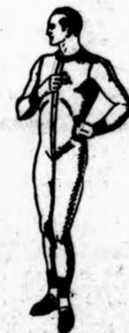
Apatiniai Union Siutai

Kaklaraišcinai, tikro šilko, rankomis pasiuti, įvairių spalvų, vertės $1.00, parsidavė po 50c., o 50c. vertės po 25c. Vertės $1.50 dabar po $1.00