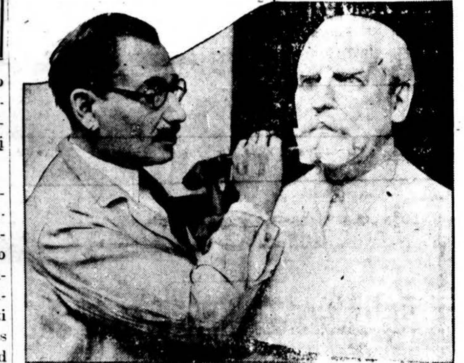
Dailininkas Moses Dykaar baigia daryti Charles'o Evans'o Hughes'o bustą, kuris bus pastatytas Nacionaliam muzejuje, Washington'e.

Gėda ant gėdos būti katalikais, turime kovoti ne su katalikais, o su skaityti bedievišką laikraštį prieš mašinų tobulinimą, bet raštį,