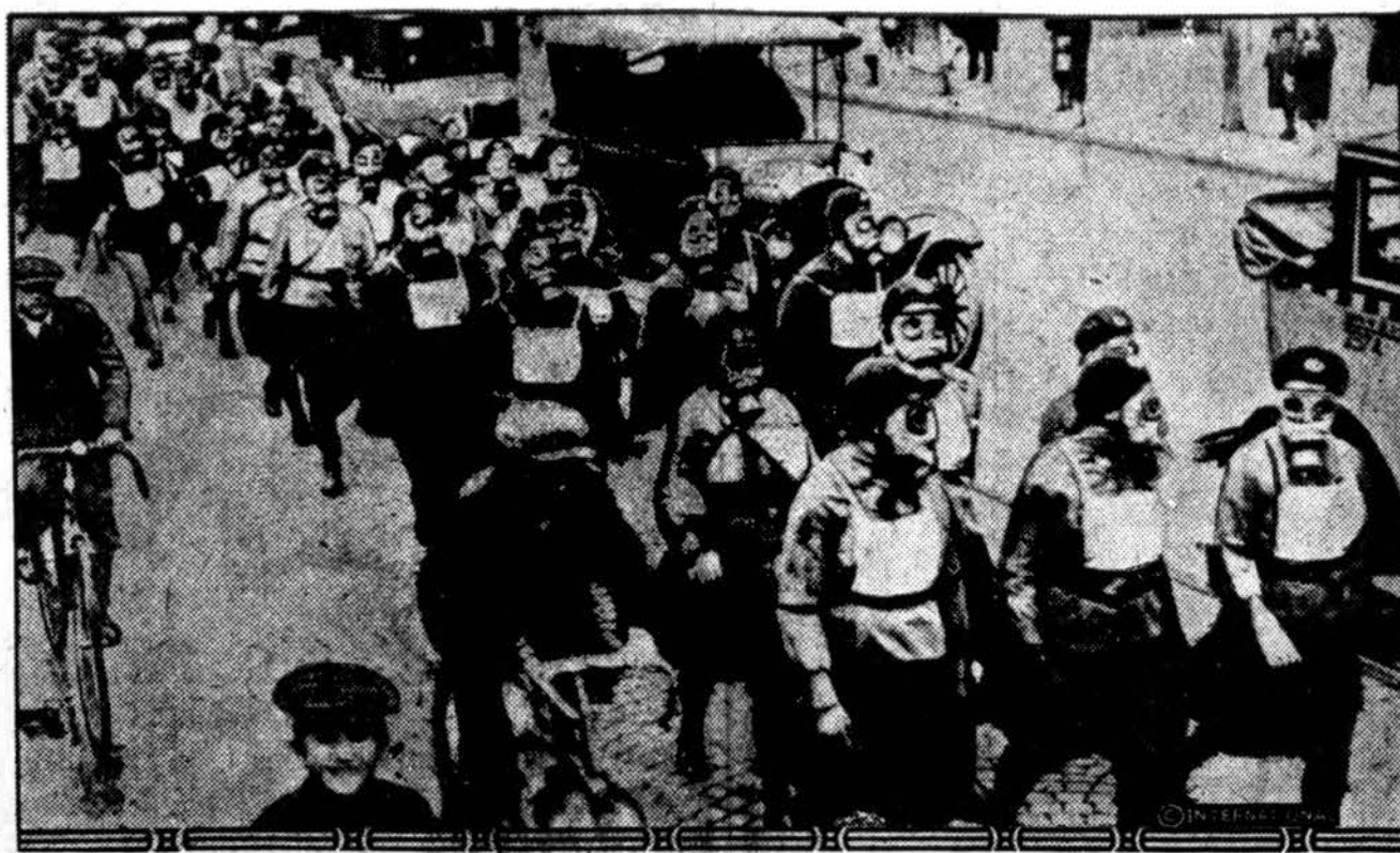
Lenkijos moterys parengiamos būsiamajam karui — eiti karo tarnybos pareigas — vyrams gelbėti. Viena moterų organizacija su kaukėmis žygiuoja Varšuvos gatvėmis.

Iš Paryžiaus praneša, kad Prancūzijos vyriausybė labai susidomėjusi šia Italijos ministro kelione.