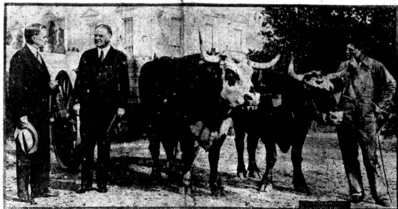
Prieš Padėkos dieną iš vakaro įjungtais vežiman šiais veisliniais jaučiais į Baltuosius Rūmus prezidentui Hoover'ui atvežta bulvių iš Maine valstybės.

Vera Cruz'o valstybėje vy- ksta žiaurūs katalikų perse-