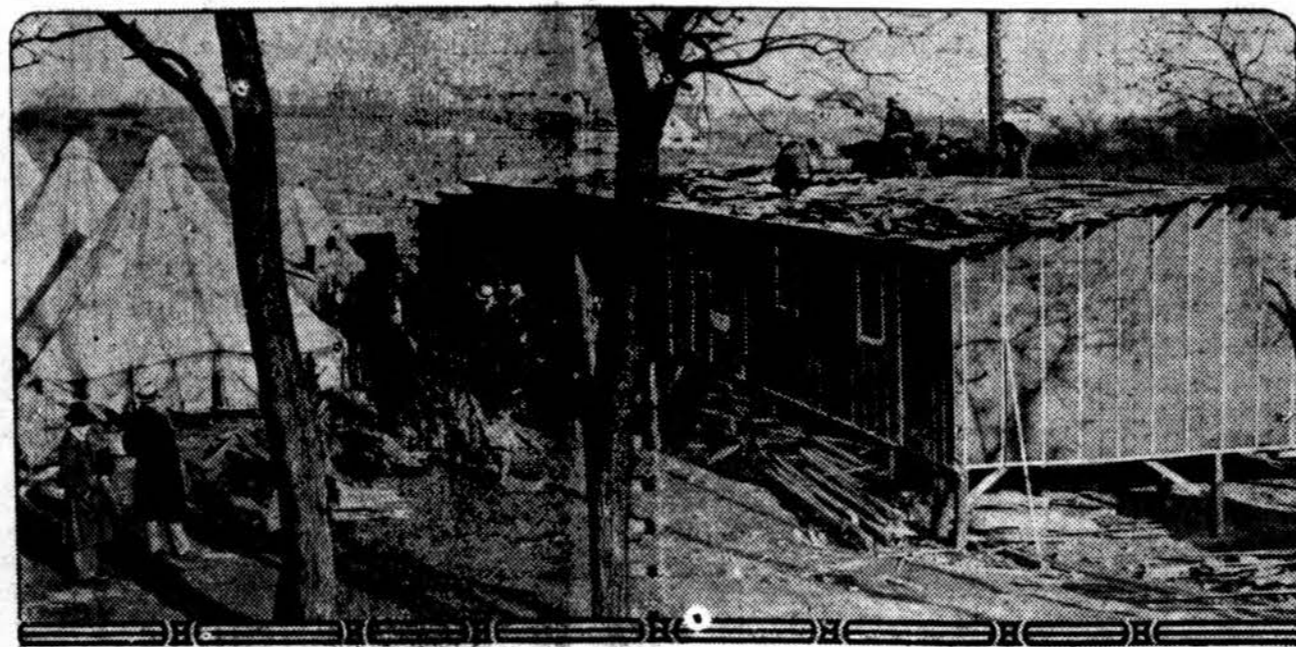
Šie nameliai statomi streikuojantiems Coverdale, Pa., angliakasiams praleisti žiemą. Kasyklų savininkas streikuojančius darbininkus ir jų šeimynas pašalina iš savo kasyklų namų.