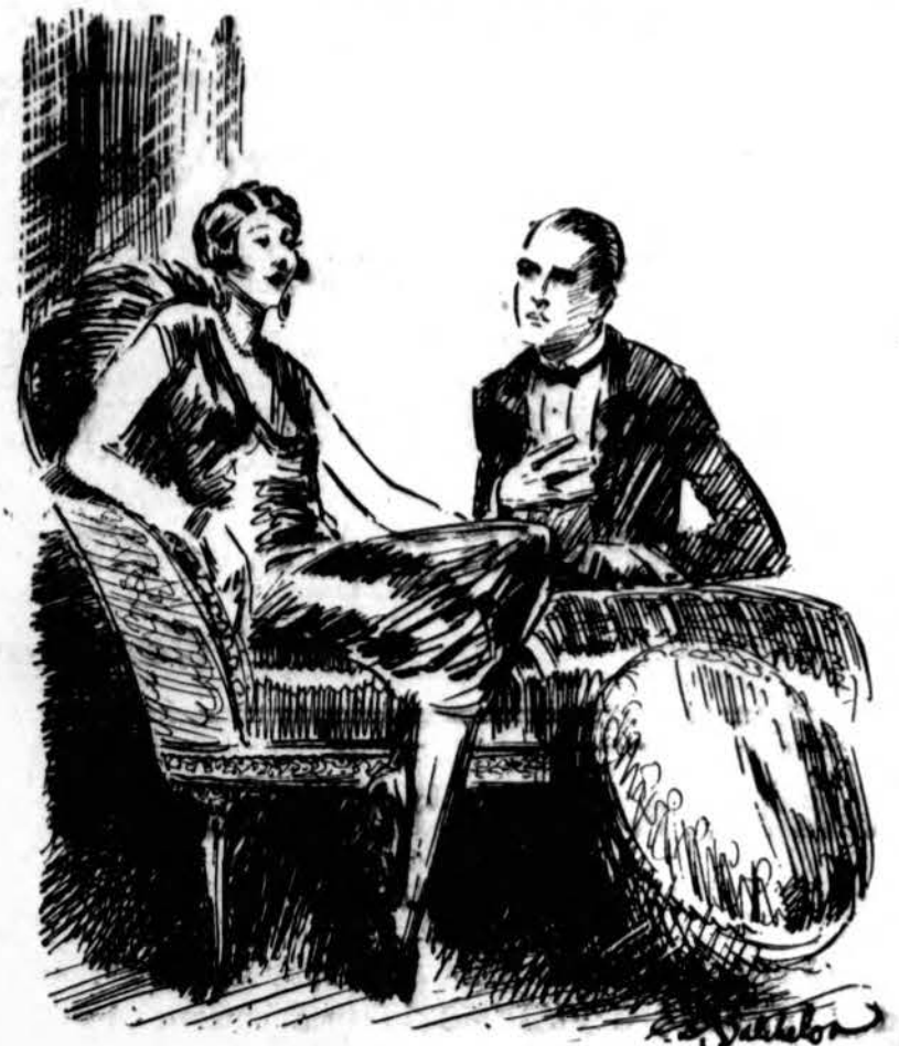
PEARLS CAST BEFORE PEARL. Co-Eddie—"I'm mad about you. I adore you. You are the most beautiful thing I ever lapped with these tired eyes. Say, kid, I love you madly. I can't live without you. Won't you wear my pin?" Co-Ed—"Oh! Go on. Say some more. You make love just like a caption writer."

eglatėmis ir gyvomis gėlėmis buvo papuošti. Kūtelė taip gi gražiai buvo istaisyta. Už taip gražų papuošimą Šv. Petro ir Povilo parapijonai labai dė- kingi seserims, klebonui ir vargonininkui. Toks altorių papuošimas per Kalėdas buvo pirmą kartą.