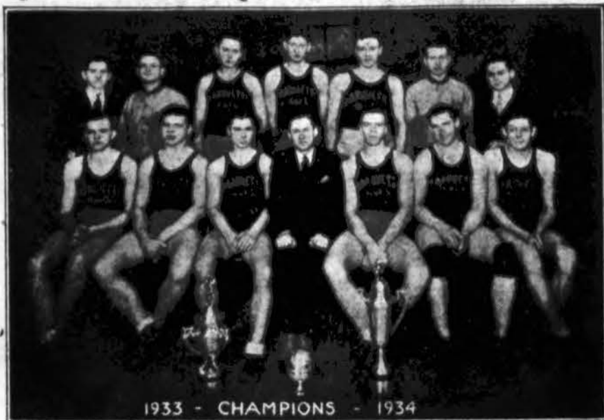
1933 - CHAMPIONS - 1934

Marquette Parko L. Vyčių 112 kuopos tybas, kuris žais L. V. Basketball Lygoje atidaryme McKinley Parke, sekmadienį, sausio 13 d. Oponentai bus Town of Lake 13 kp.