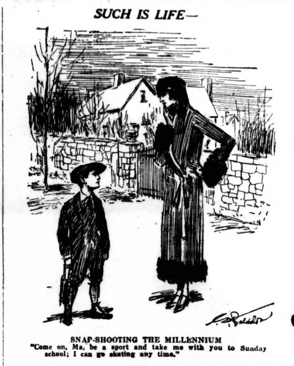
SNAP-SHOOTING THE MILLENNIUM "Come on, Ma, be a sport and take me with you to Sunday school; I can go skating any time."