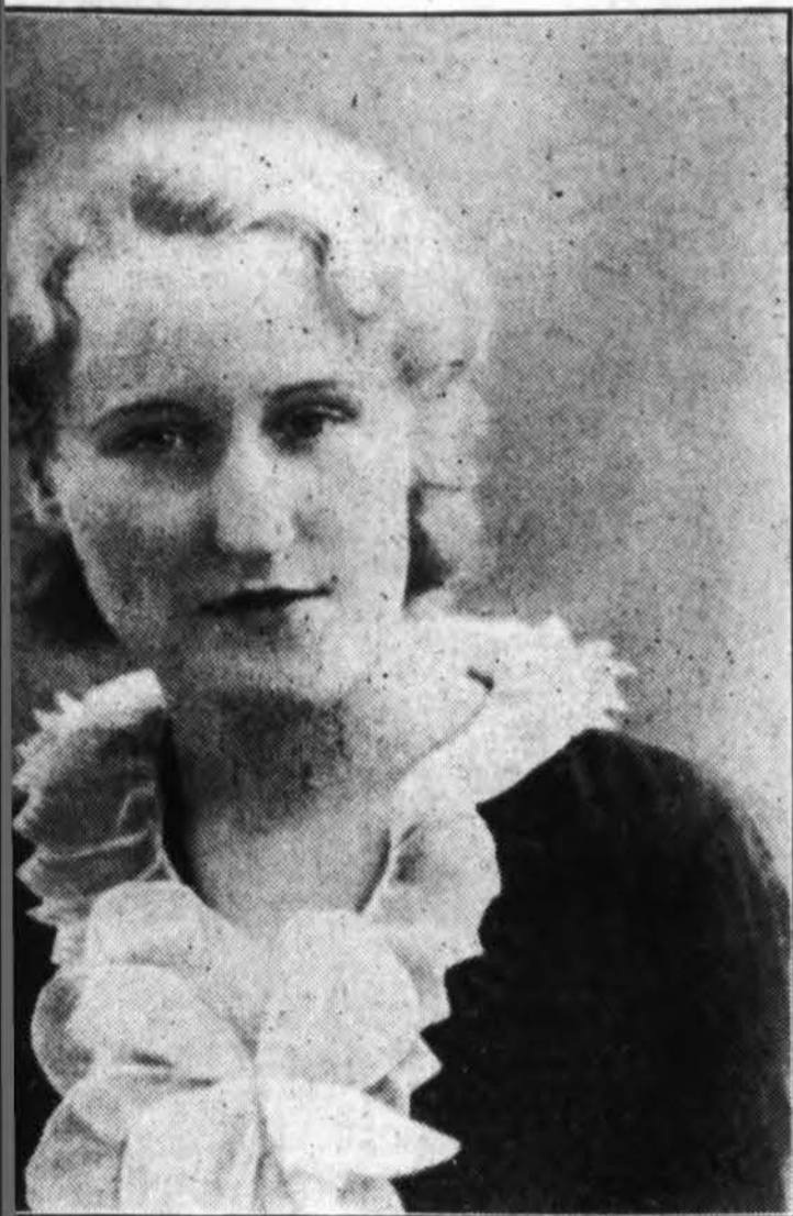
...itienė, kurios malonus soprano balsas skambės auditorijoje. Ji sudainuos keletą smagių dainų.

Tad visi rezervuokite vasario 3 d. dienraščiui "Draugui". Ateikite ir pasilinksminkite kartu su kitais mūsų dienraščio prieteliais.