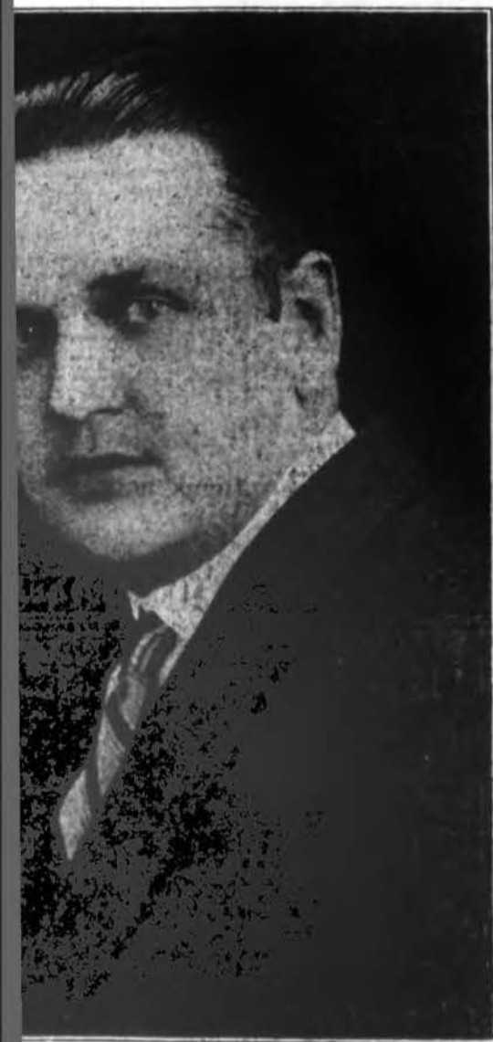
Sauris, L. V. "Dainos" choro vadovas. Jis padarys keletą pastangų priruošti savo chorą "Draugo" koncertui. Jis padarys keletą pastangų šiam koncertui.