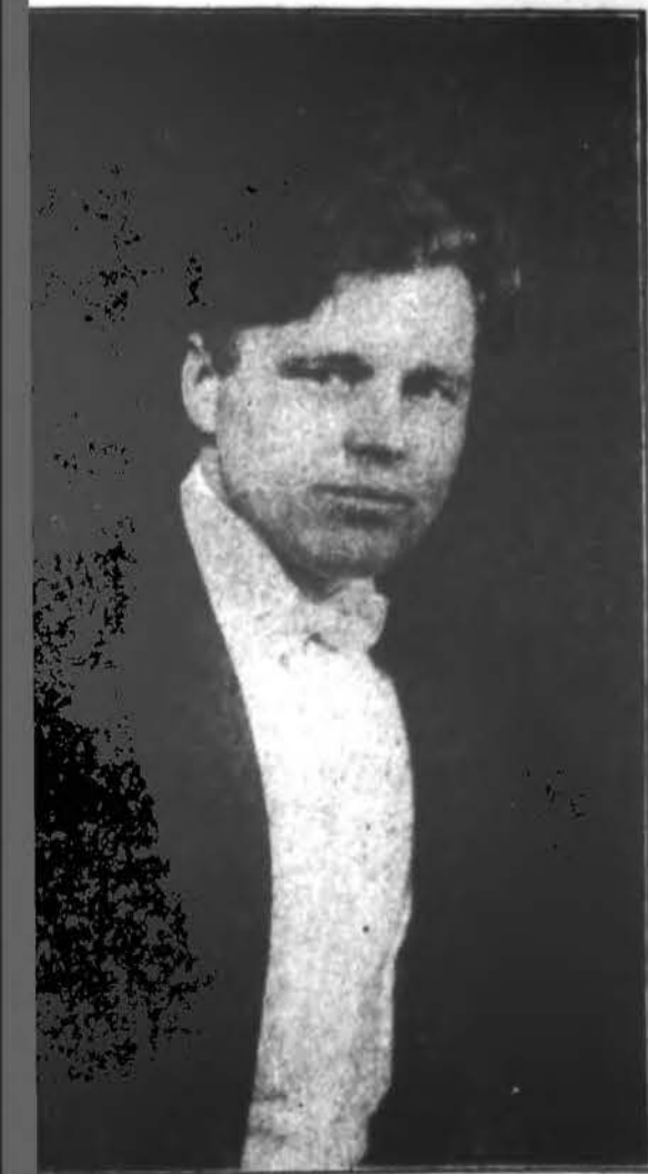
...ITIS, Aušros Vartų parapijos vadovas. Jis padarys keletą pastangų priruošti savo chorą "Draugo" koncertui.