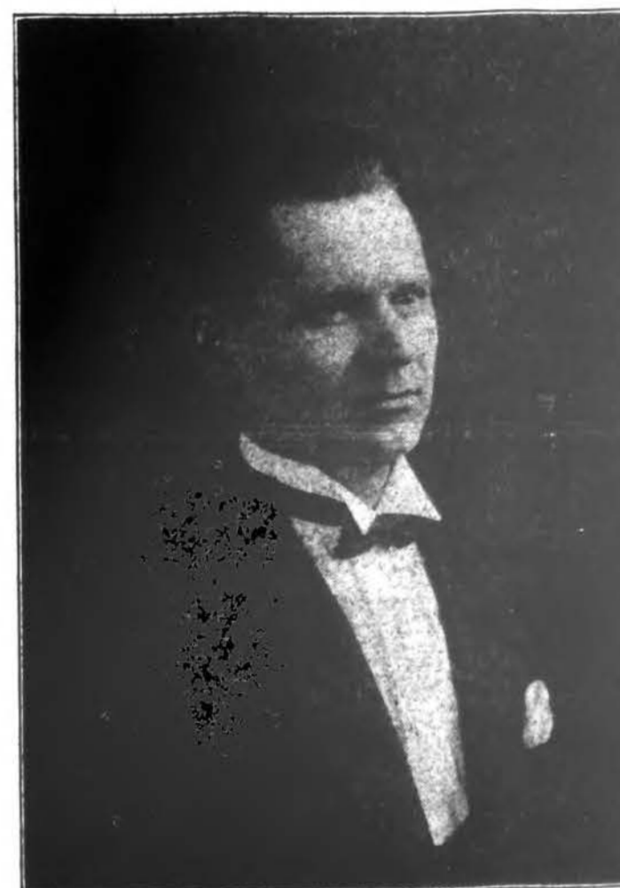
KAZIMIERAS PAŽARSKIS, žymus baritonas, dalyvaus “Draugo” vakare. Kazys turi savo balsą daug stiprumo ir moka publiką patenkinti moderninėmis kompozicijomis.