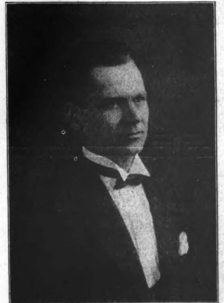
KAZIMIERAS PAŽARSKIS, žymus baritonas, dalyvaus "Draugo" vakare. Kazys turi savo balse daug stiprumo ir moka publiką patenkinti moderninėmis kompozicijomis.