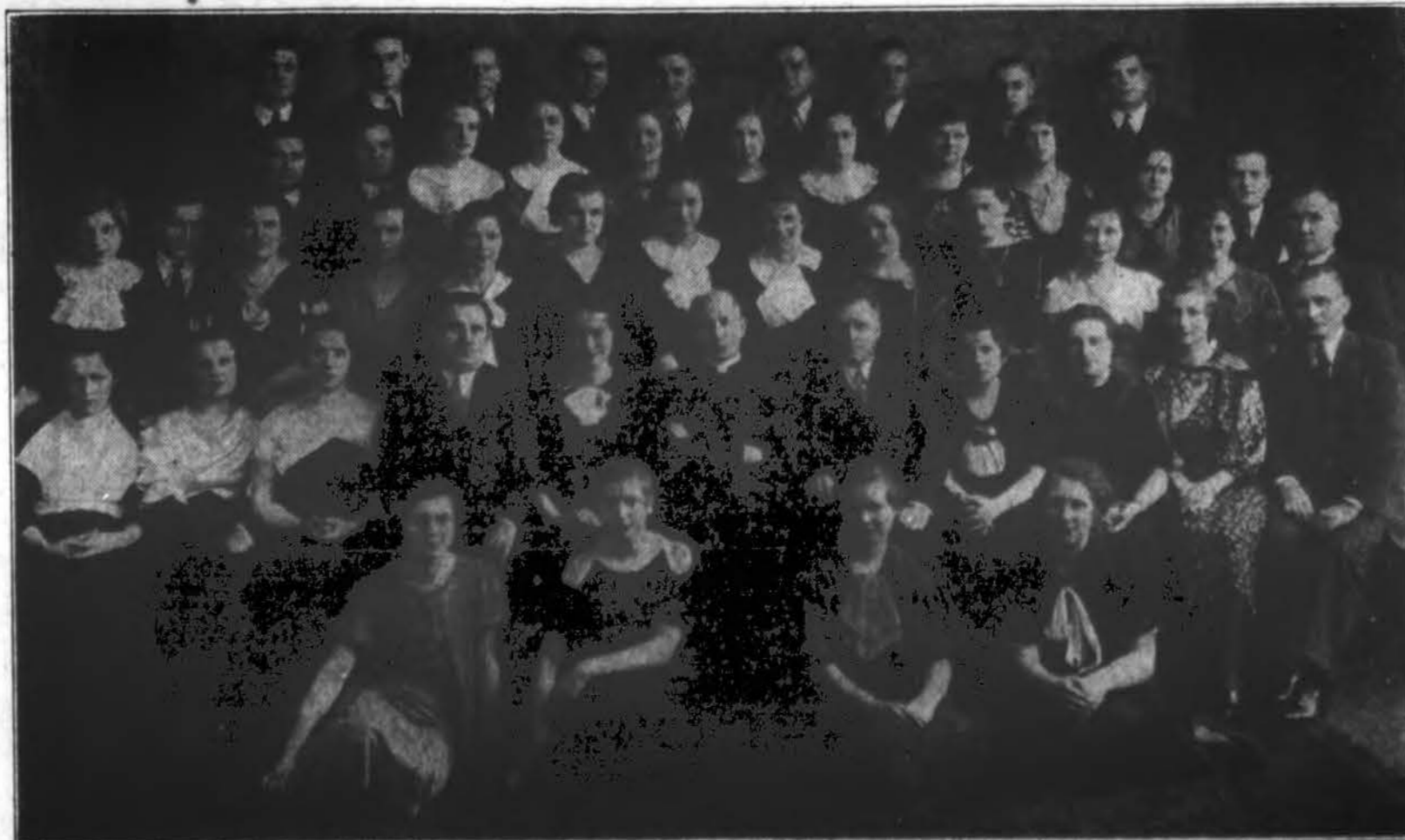
Aušros Vartų parapijos choras, vedamas J. Brazaičio, dalyvaus "Draugo" metiniame koncerte ir žada šiemet savo mėgiamų dainų "Draugo" koncerte. Jis vis dar geriau pasirodyti negu kada nors pirma. Aušros Vartų par. choristai myli dainą ir dėl dainų daug dėti pasiūlymų šventimo. Laukiame visi tos progos išgirsti jį "Draugo" koncerte.