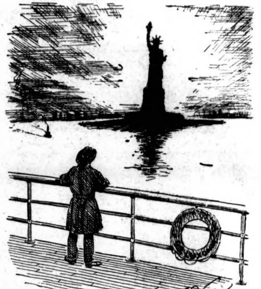
GIRLS YOU CANT FORGET

PEOPLES RAKANDŲ Išdirbystės Co. Krautuvės Dirba Aukštos Rūšies Garantuos Rakandus Pagal Užsakymą Taipgi TAISO SENUS RAKANDUS Už prieinamiausią Kainą Mieste! Dėl informacijų telefonuokite HEMLOCK 8400