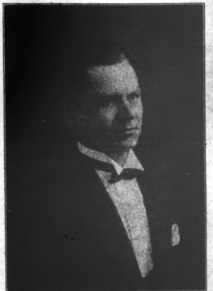
KAZIMIERAS PAŽARSKIS, žymus baritonas, dalyvaus "Draugo" vakare. Kazys turi savo balse daug stiprumo ir moka publiką patenkinti moderninėmis kompozicijomis.