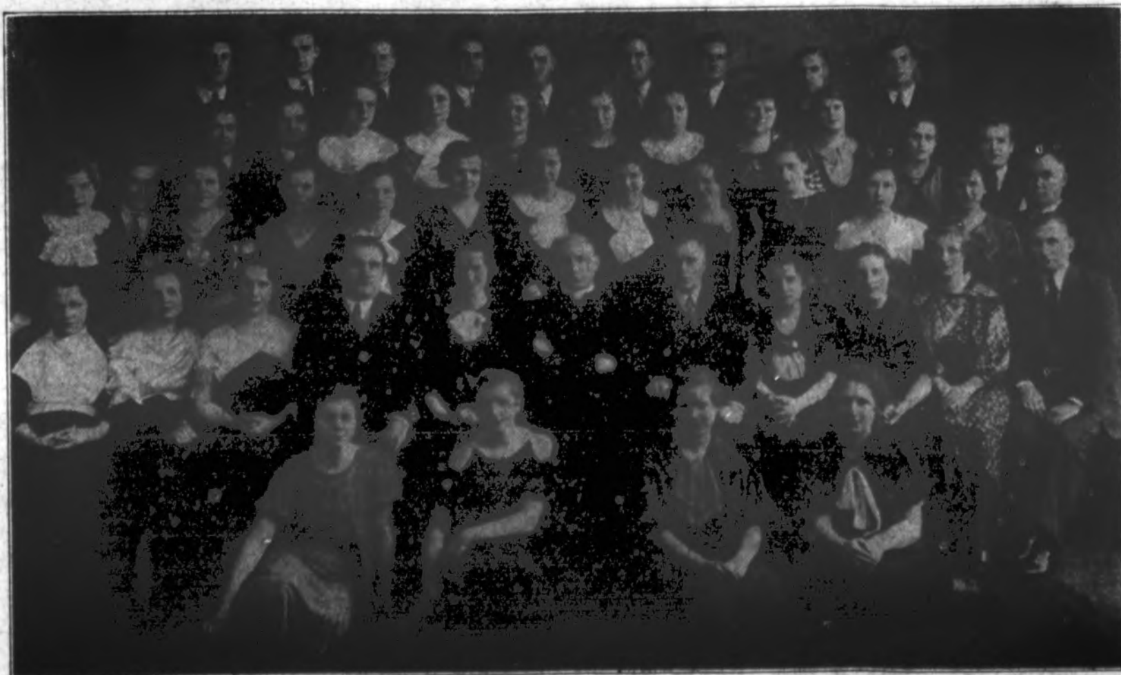
Aušros Vartų parapijos choras, vedamas J. Brazaičio, dalyvaus "Draugo" metiniame koncerte ir žada šiemet savo geriau pasirodyti negu kada nors pirma. Aušros Vartų par. choristai myli dainą ir dėl dainų daug deda pasižvėtimo. Laukiame visi tos progos išgirsti jį "Draugo" koncerte.