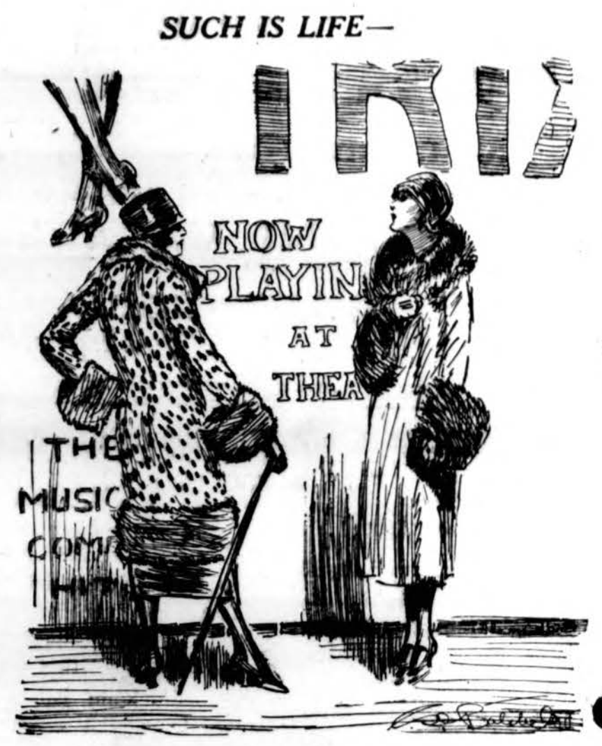
"Has Trixie's show had a good run?" "Yes, Ann; any show with her legs in it is well."