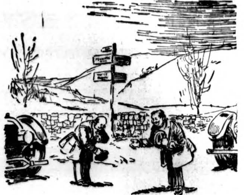
SNAP-SHOOTING THE MILLENIUM Two motorists each urging the other to take the right-of-way.