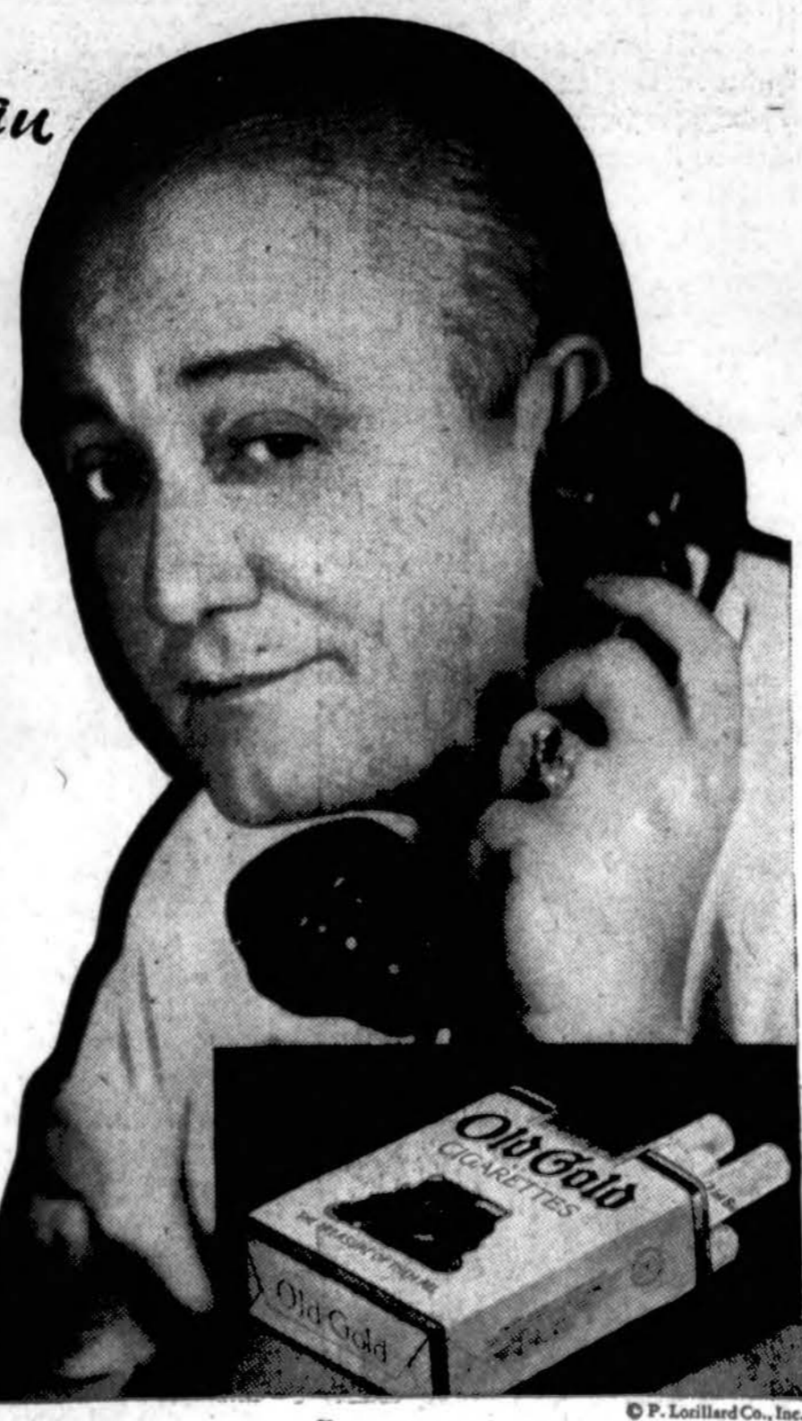
Švelnus gerklei CIGARETAI © P. Lorillard Co., Inc.

Švelniausi AMERIKOS CIGARETAI GEORGE M. COHAN... Pirmos Rufles Aktorius, Pasijymėjęs Rašytojas ir Producceris