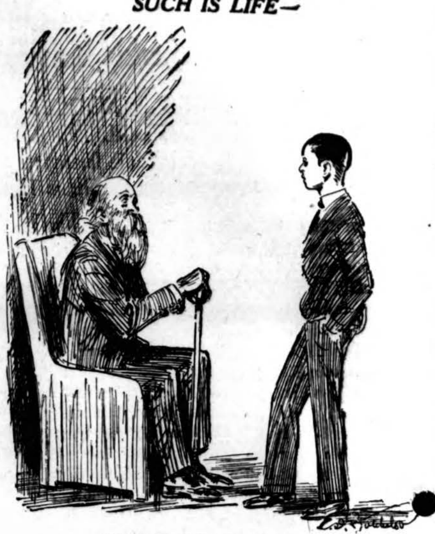
SNAP-SHOOTING THE MILLENIUM. Veteran: "Then, sonny, we ran from the enemy as fast as our legs could carry us, though we outnumbered them two to one."