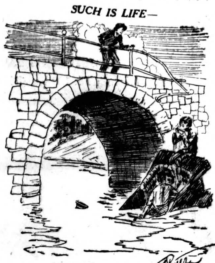
THE ETERNAL FEMINE